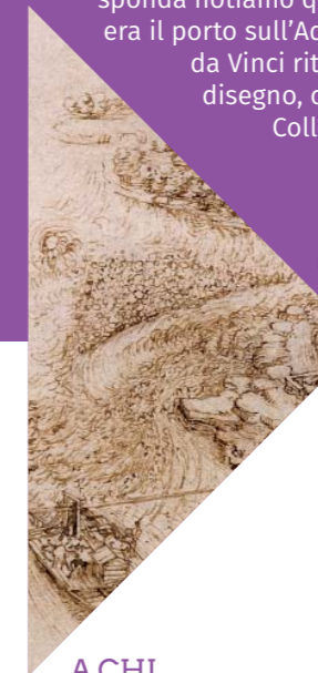
Disegno di Leonardo da Vinci Picture by Leonardo da Vinci

Iniziamo l'itinerario dalla villa Melzi d'Eril dove Leonardo da Vinci soggiornò per diversi periodi. Camminiamo lungo via Motta fino a piazza Cavour dove, dal fondo della piazza, possiamo godere di uno dei panorami più belli del territorio: la vista sull'Adda e Martesana. Seguiamo la scalinata e percorriamo la passerella elicoidale "Il Vortice" che ci porta su via Alzaia sud. Arriviamo alla Casa del Custode delle Acque e visitiamo la Galleria Interattiva "Leonardo in Adda". Dirigiamoci verso il ponte sull'Adda e - appena oltre, sulla sinistra - imbocchiamo via al ponte. Giunti in cima alla salita volgiamo lo sguardo verso il fiume: sull'altra sponda notiamo quello che una volta era il porto sull'Adda e che Leonardo da Vinci ritrasse in un celebre disegno, oggi custodito nelle Collezioni Reali inglesi.