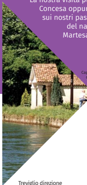
Cappella lungo il Naviglio dedicata alla Madonna Chapel dedicated to the Madonna by the Naviglio Martesana

Partiamo dall'area della diga in prossimità di via Visconti e percorriamo la strada fino a incontrare il cotonificio Visconti di Modrone-Velvìs. Qui vediamo l'affresco della Madonna ferita. Seguendo la strada, poco dopo, si arriva alla Casa del Custode delle Acque. Percorrendo la via Alzaia sud incontriamo la passerella elicoidale "Il Vortice" e, poco oltre, il ponte sull'Adda. Continuiamo la nostra passeggiata lungo via Alzaia nord e arriviamo alla cartiera Sottrici-Binda. Proseguiamo il nostro cammino immersi nel verde e costeggiando il naviglio Martesana fino ad ammirare la ruota idraulica in ferro che serviva a rifornire d'acqua la soprastante villa Castelbarco. La nostra visita può proseguire fino a Concesa oppure possiamo tornare sui nostri passi seguendo il corso del naviglio fino via Alzaia Martesana e raggiungere la cappellina dedicata alla Madonna.