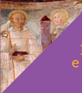
Affresco nella chiesa di San Colombano Fresco in the church of San Colombano

Our visit begins at villa Castelbarco, in via Concesa then passing through via xxv Aprile we reach via Motta, where we can admire two villas, Monti Robecchi and Pizzi Guidoboni. We arrive in piazza Leonardo da Vinci where we can admire villa Melzi d'Eril. We continue on and arrive in piazza Cavour where we can see palazzo Simonetta Archinto. Walking down via Magenta we can see villa Archinto, and further along, in via Sant'Antonio, we can see villa Sioli Guidoboni and villa Paleni Falcò. We then reach via Alzaia sud. Immediately after the Casa del Custode delle Acque we can admire the facades of the villas, mirrored in the Martesana waters: villa Visconti di Modrone, villa Pizzagalli Alessandrini, villa Melzi d'Eril, villa Pizzi Guidoboni and villa Monti Robecchi. An alternative route brings us to via Alzaia sud and again views of the villas: a flight of steps in the park in via don Moletta brings us directly to the naviglio waters!