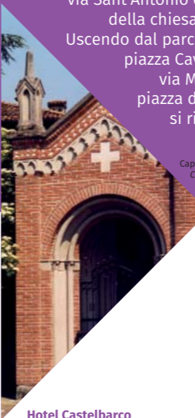
Cappella dedicata a San Rocco Chapel dedicated to Saint Rocco

La romanica chiesa di San Colombano è la prima tappa del percorso. Percorriamo via don Moletta fino ad arrivare in piazza della Chiesa dove troviamo la chiesa di San Nicolò all'interno della quale si ammirano gli affreschi del pittore vapiense Natale Riva, allievo di Francesco Hayez. Imbocchiamo via Mazzini fino a osservare la cappella di San Rocco. Percorriamo ora il passaggio pedonale e ciclabile alla destra del monumento, svoltiamo a destra lungo via Motta e continuiamo fino piazza Cavour. Qui imbocchiamo via Magenta fino via Sant'Antonio dove troviamo la chiesa di Sant'Antonio risalente al XVII secolo. Attraversiamo il parchetto in via Sant'Antonio e giungiamo ai resti della chiesa di San Bernardino. Uscendo dal parchetto ci si ritrova in piazza Cavour e, percorrendo via Matteotti, si arriva in piazza della chiesa da dove si ritorna alla chiesa di San Colombano.