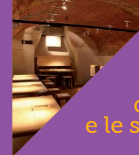
Galleria interattiva "Leonardo in Adda" The interactive gallery exhibition "Leonardo in Adda"

We set off from the dam close to via Visconti and walk until we reach the Visconti di Modrone-Velvìs factory. Here we can examine the fresco depicting the Wounded Madonna. Following the road we soon come to the Casa del Custode delle Acque. Passing through via Alzaia sud we reach the spiral footpath known as 'Il Vortice' and, further along, the Adda bridge. Strolling along via Alzaia nord, we shortly reach the Sottrici-Binda paper factory. We plunge into the greenery of naviglio Martesana and reach the iron water wheel used to supply water to villa Castelbarco. We can then either continue on to Concesa or return, following the course of the naviglio canal as far as via Alzaia Martesana until we arrive at the small chapel dedicated to the Madonna.