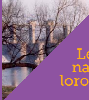
La diga The dam

The Romanesque church of San Colombano is our first stop. We walk through via don Moletta to reach the square dedicated to the church of San Nicolò: inside we can admire frescos painted by local artist Natale Riva, a pupil of Francesco Hayez. Going down via Mazzini we then come to the chapel of San Rocco. We now take the pedestrian and bike path on the right of the shrine, and then turn right into via Motta; we keep going until we reach piazza Cavour. From here we take via Magenta as far as the junction with via Sant'Antonio where we find the church with the same name, dating back to the seventeenth century. We go through the small park in via Sant'Antonio and arrive at the excavation site of the church of San Bernardino. Leaving the park we find ourselves in piazza Cavour and from there we can walk down via Matteotti towards piazza della Chiesa and then head back to the church of San Colombano.